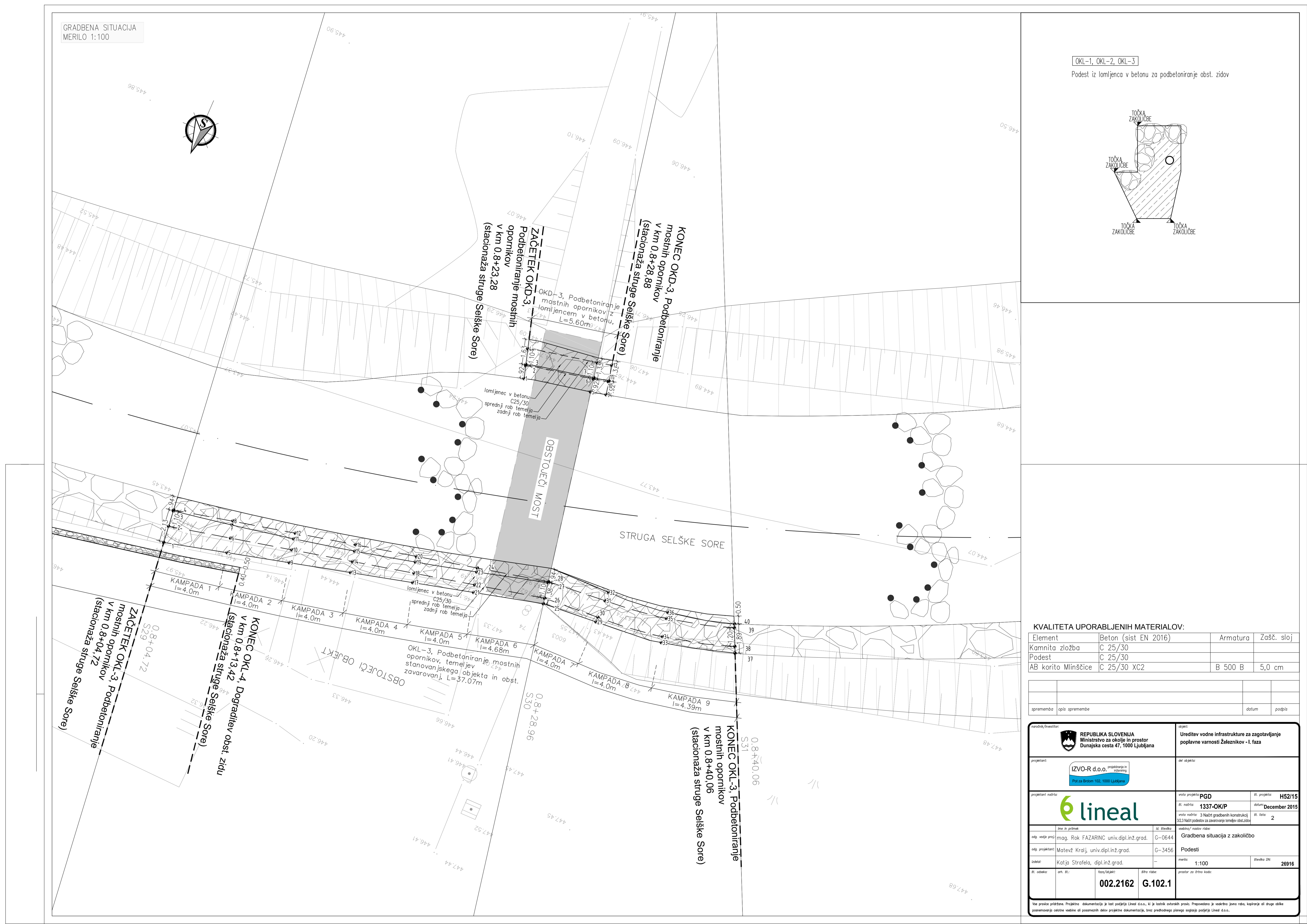
OKL-1, OKL-2, OKL-3 Podstla iz kamnjca v betonu za podbetoniranje steb. steb.