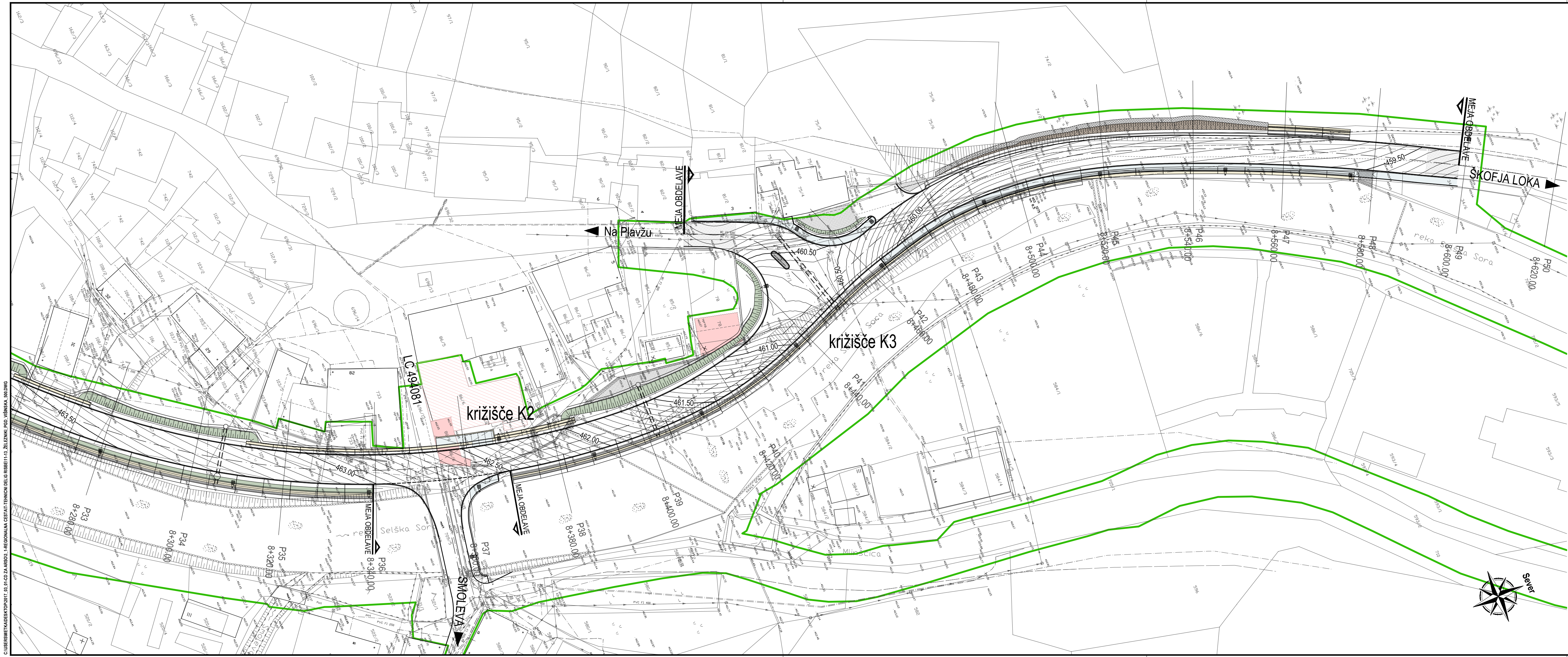
Višinska situacija od km 8+240 do km 8+599 M 1:500